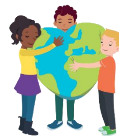
We hebben hart voor elkaar

Voor de groepen 7 en 8 worden ook lessen in hetzelfde thema gegeven, maar bestaan er geen kletskaarten.