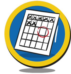
Plan- & Regelkracht

Modeling is een belangrijke vaardigheid voor leerkrachten: door zelf ook goed te plannen en te organiseren en dat hardop uit te spreken, leren kinderen ontzettend veel van je. Een opgeruimd lokaal is daarbij een must.