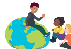
We hebben oor voor elkaar

De kinderen leren wat goed en slecht luisteren is. In tweetallen oefenen de kinderen om naar elkaar te luisteren. De een vertelt, de ander luistert. Goed luisteren kan je zien aan oogcontact, knikken, actieve lichaamshouding en herhalen wat de ander zei.