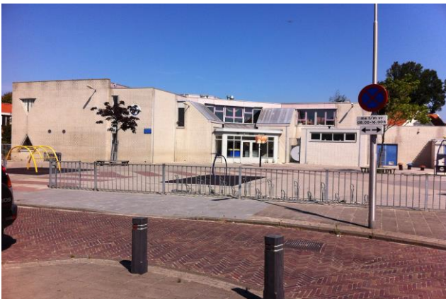
Locatie West Onderbouw