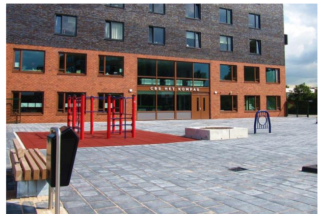
Locatie West Bovenbouw