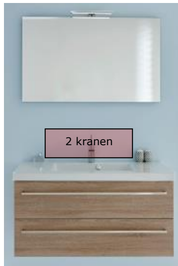
Badkamermeubel , 90 cm breed met spiegel v.v. ledverlichting, dubbele wastafelkraan en keramische wastafel