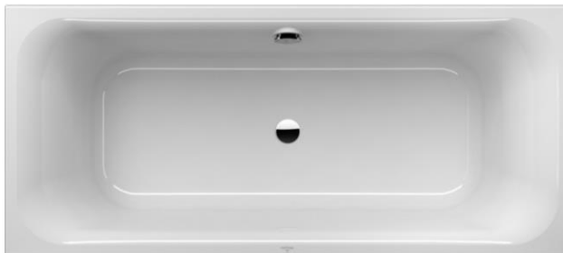
Liqbad 1800x800 mm