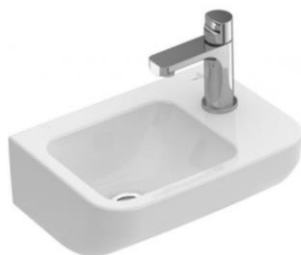
Hoekfontein (Villeroy & Boch architectura 36x26 cm)