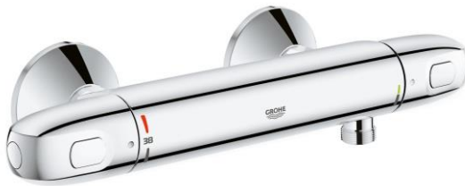
Douchemengkraan (Grohe Grohtherm 1000 New)