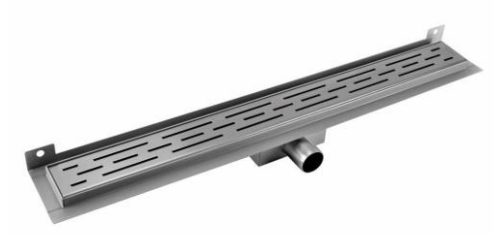
Douchedrain rvs (70 cm x 7 cm)