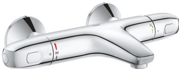
Badmengkraan (Grohe Grohtherm 1000 New)