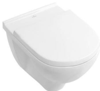
Wandcloset met zitting (Villeroy & Boch O Novo)