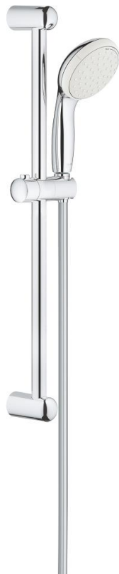
Glijstangcombinatie (Grohe Tempesta New)