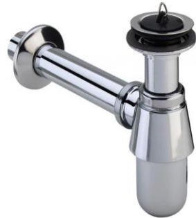
Plugbekersifon met muurbuis (Viega project)