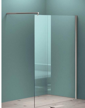
Douche scherm 900x2000 mm (v.v. montage stang)