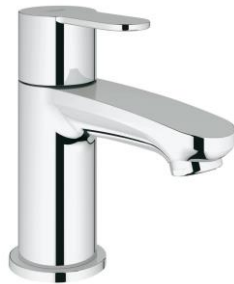
Wastafelkraan (Grohe Eurostyle Cosmopolitan)