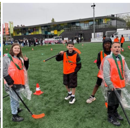
De regencapes (die bedoeld waren voor de optocht) kwamen goed van pas bij de Koningsspelen!