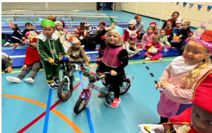
Groep 1-2 C: flink oefenen zodat er mooie optredens te zien waren voor Sinterklaas.