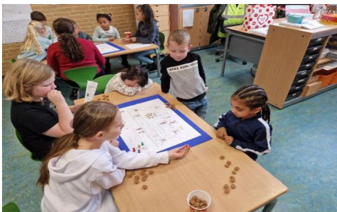
Groep 1-2 B: Samen met de kinderen uit hogere groepen rekenspelletjes gedaan met de pepernoten.