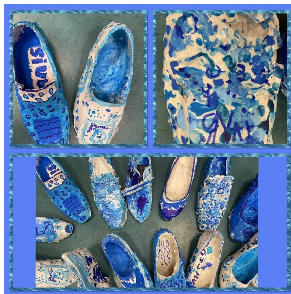
Oh kom maar eens kijken, in ons Delfts blauwe schoentje!!