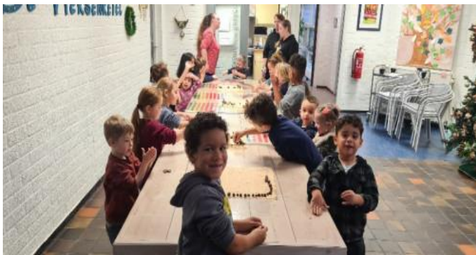
Groep 1-2 A: Pepernoten gebakken bij onze burens de Heksenketel.

In de groepen 1-2 werd er hard gewerkt voordat Sinterklaas op school kwam.