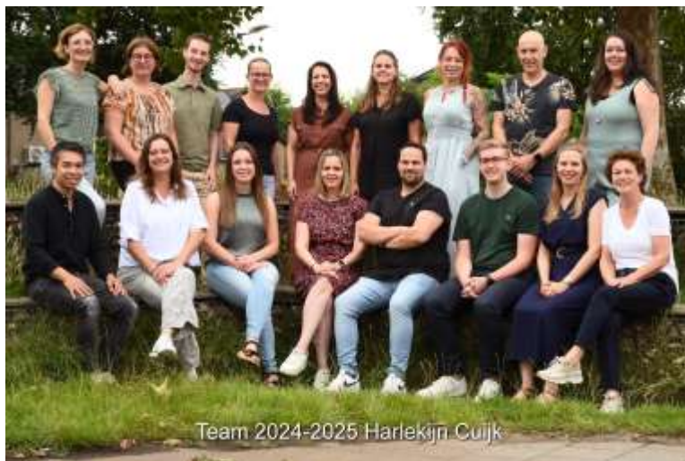
Team 2024-2025 Harlekijn Cuijk