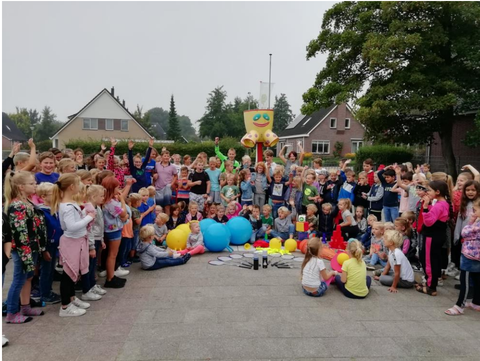
Een foto van het nieuwe materiaal dat we met de -munten actie hebben gekregen.