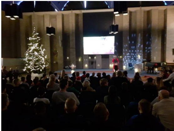
Gerda Luiks opent het Kerstfeest