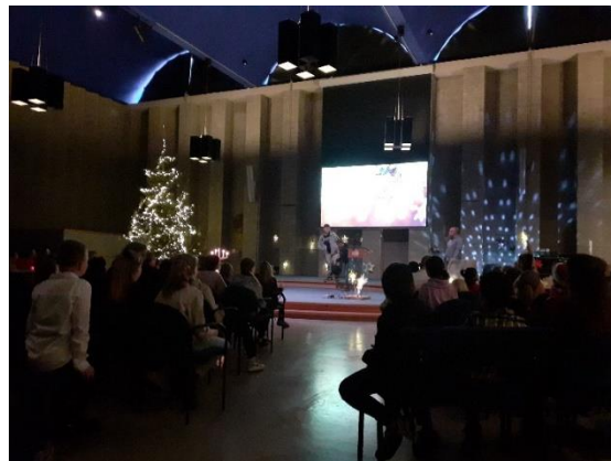
'Floris' en 'Matteo' (de acteurs in het toneelstuk)