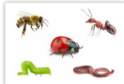
Heel veel beestjes