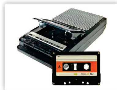
Luisteren naar een cassettebandje

Groetjes van de Specht, Kraanvogel en Zwaluw