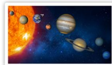
Planeten en sterren in de ruimte

Om 08.25 uur gaat de schoolbel, zodat om 08.30 uur de lessen kunnen beginnen.