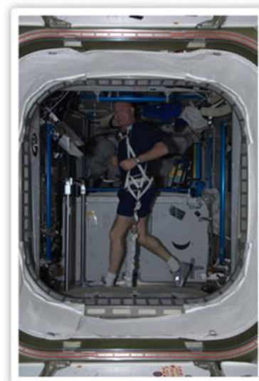
Hoe is het om astronaut te zijn?