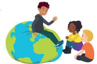
We hebben oor voor elkaar