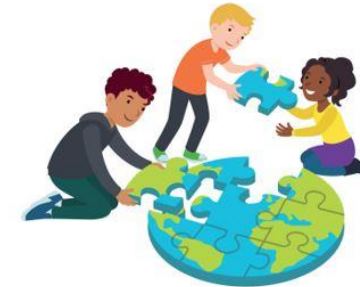
We dragen allemaal een steentje bij