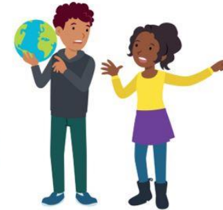
We lossen conflicten zelf op