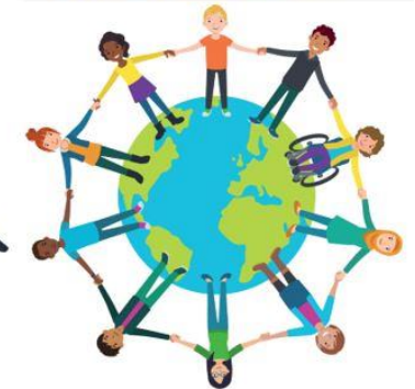
We zijn allemaal anders