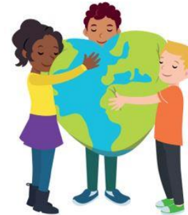
We hebben hart voor elkaar