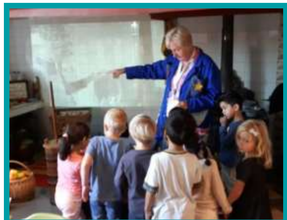
Excursie Museum Elisabeth Weeshuis

Daarnaast hebben de kinderen op jaarbasis een aantal dagen vrij. Deze kunt u terugvinden op de jaarkalender en op de website.