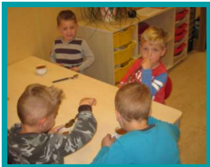
Spinnensoep eten bij het project herfst