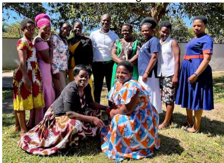
De nieuwe nanny's met mensen van de jeugdzorg

We wonen inmiddels alweer 6 weken in ons nieuwe huis in Lilongwe en het gaat heel goed met ons. We hebben een nieuw team nanny's die heel goed zijn met de kinderen. De nanny's zijn betrouwbaar en werken hard. Ze werken goed samen en komen iedere dag vol enthousiasme naar hun werk. Belangrijk is dat ze oprecht geïnteresseerd lijken in het zorgen voor onze weeskinderen en het niet alleen doen voor het geld. Momenteel ondergaan de nanny's een 5-daagse training van jeugdzorg. In deze training leren ze van alles over hoe ze nog beter voor de kinderen in ons huis kunnen zorgen en nog veel meer. Ik ben ontzettend dankbaar en blij dat we deze nanny's gevonden hebben want het is zo veel leuker om dit werk te doen met een goed team rondom je heen.