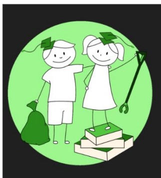
Samen zorgen we voor een schone en opgeruimde schoolomgeving.

Burgerschap is een verplicht vak en samen met de leerlingenraad hebben we besloten om werk te maken van een schone en opgeruimde school. We vragen aan iedereen om zo min mogelijk afval mee te nemen én om restafval weg op de juiste manier weg te gooien. Samen met de leerlingen kijken we naar ons schoolplein en bespreken we wat we kunnen doen om het schoon te houden. U doet toch zeker ook mee?