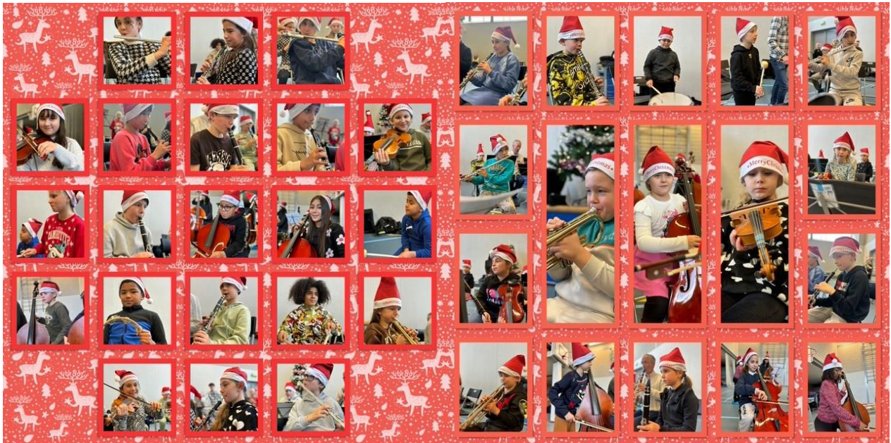
Leerorkest Broederschool groep 6