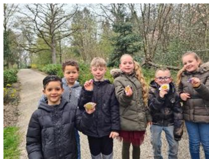
Kijk eens wat wij hebben gevonden.....