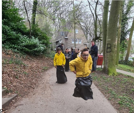
Speurtocht in het Aambos met de Paashaas