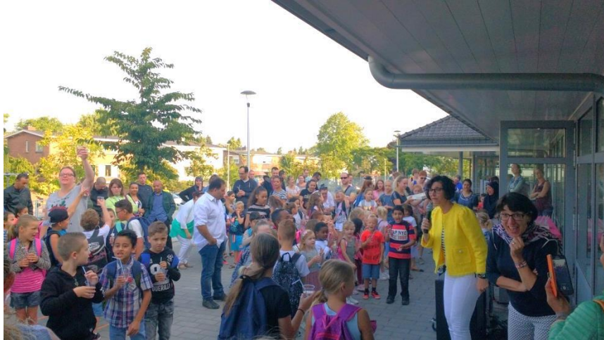
Opening schooljaar 2017 - 2018