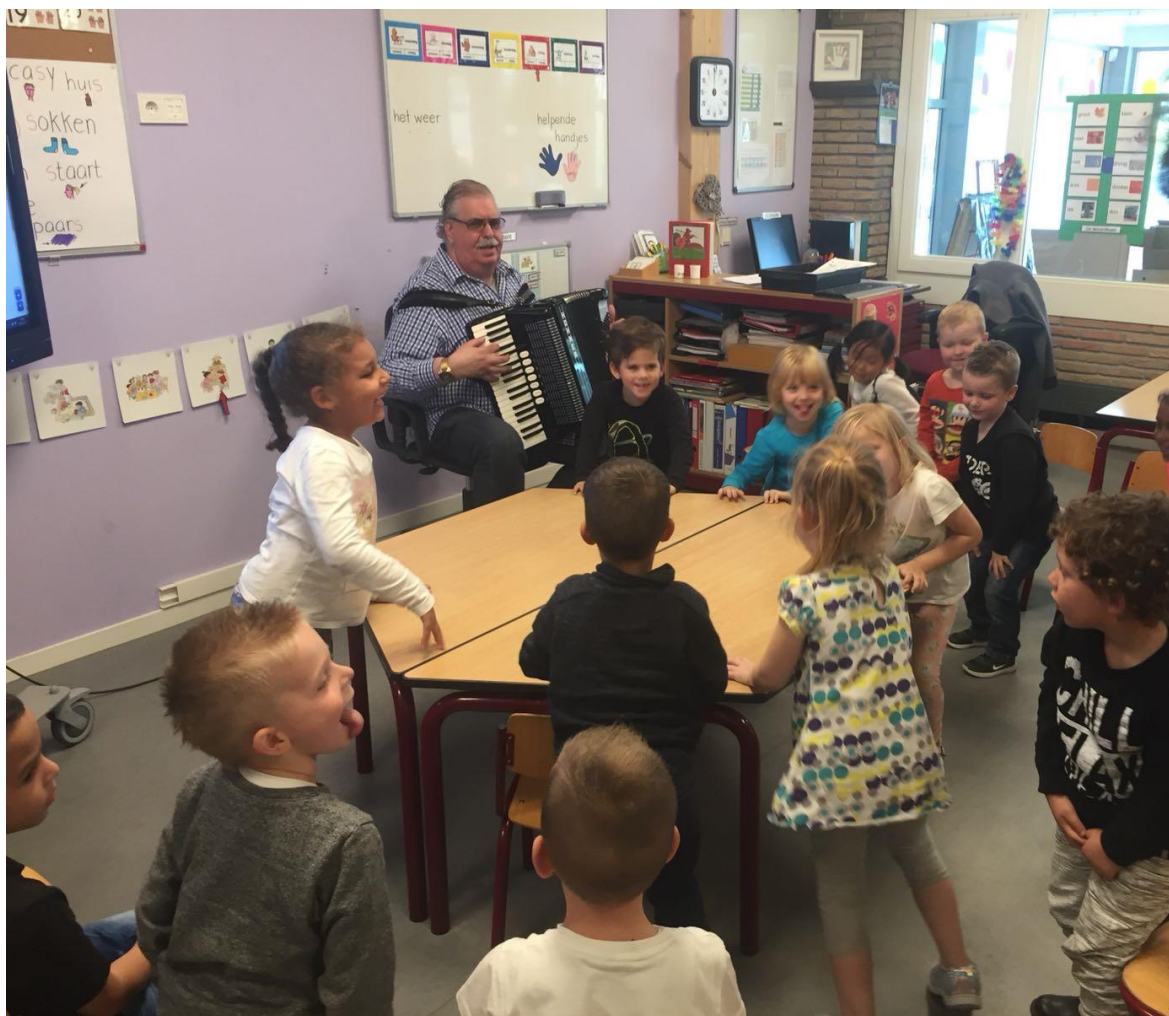
De leerlingen van groep ½ B dansen mee op de vrolijke klanken van het accordeon.