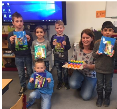
Groep 3-4 laat trots de prijsjes zien.

Zij hebben de prijs inmiddels in ontvangst genomen.