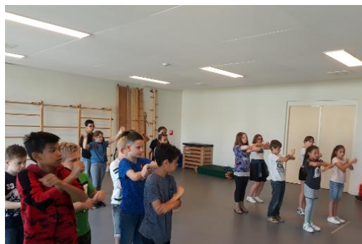
Oefenen voor de dans.

Dinsdag 26 juni: Gezamenlijk uitje Tierpark in Aachen.