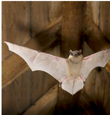
De Laatvlieger