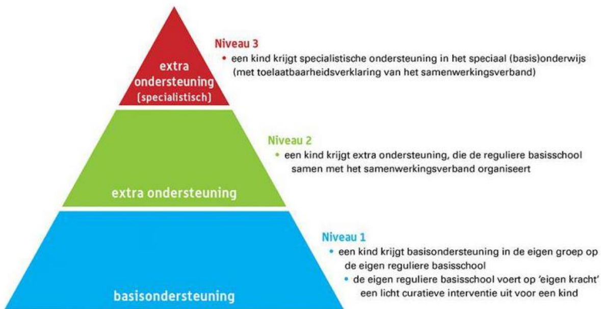
Figuur 1: ondersteuning in Passend Onderwijs

Volgens passend onderwijs zijn er 3 categorieën van ondersteuning. In figuur 1 is weergegeven hoe de ondersteuning in passend onderwijs is vormgegeven.