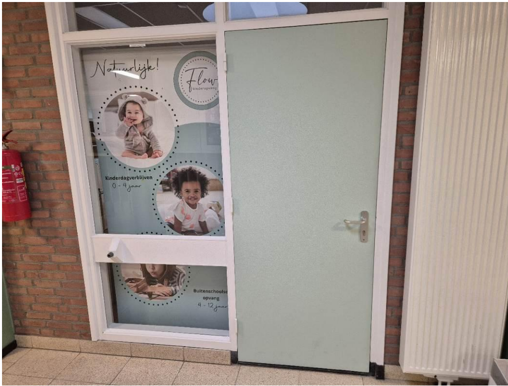
Het BSO-lokaal van Flow op De Bolster, de eerste stap is gemaakt.