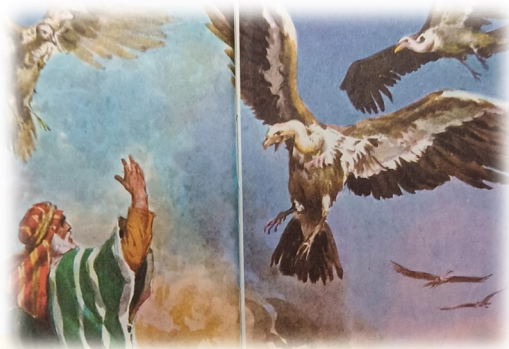
Bron: Gedachten uit een preek uit Renswoude.

De mens verbreekt voortdurend (in gedachten, woorden of daden) Gods geboden en bedoeling. Wat een wonder dat God hierin de getrouwe is. Hij liet Zijn Zoon breken aan het kruis, verzoening aangebracht, toen wij nog onwetend waren. Laten we alle gedachten die ons weghouden bij dit volbrachte werk wejagen en verdrijven!