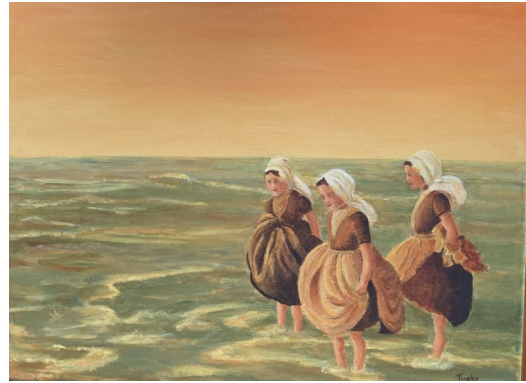
C. Meisjes aan strand 30x40