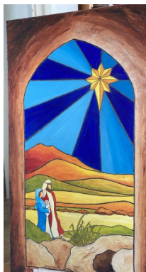
F. Kerst 30x +/- 85