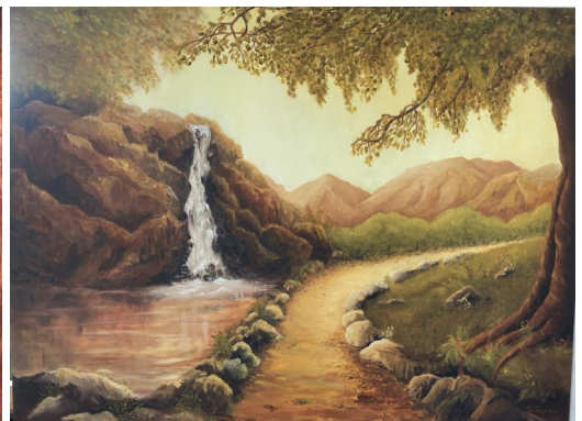
G. Landschap 60x80 olieverf