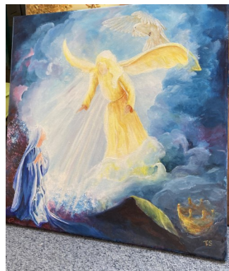
E. Engel bij Maria 40x40