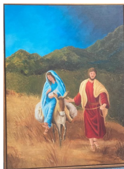
I. Jozef en Maria 60x80