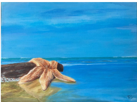
H. Zeester 30x40