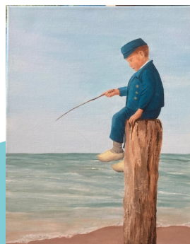
J. jongetje op strandpaal 40x50