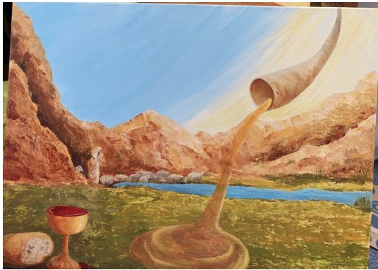
B. Ps23 deel 2 60x80