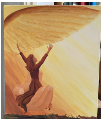
D. Ps 63 +/- 50x60