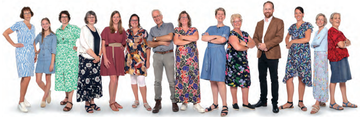
Personeel School met de Bijbel

De kleuren en symbolen in de bladvorm (wat staat voor groei) hebben van oudsher een symbolische betekenis. Samen met u als ouders/verzorgers willen we hier graag aan werken, ten gunste van de kinderen!