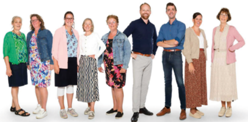
Personeel School met de Bijbel

Praktische informatie zoals contactgegevens, schoolvakanties, belschema's en externe contacten vindt u in onze schoolgids 'Deel A', de kalender.