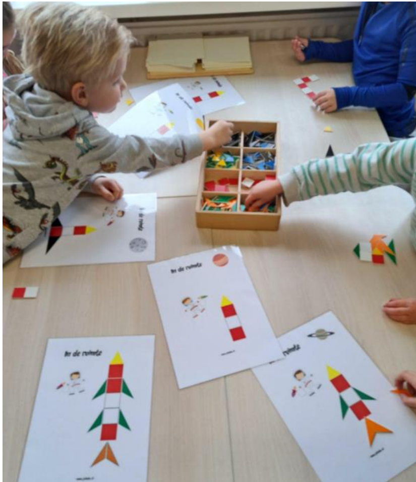
Thema “in de ruimte” groep 1/2 B

Kleuters die starten bij aanvang van het nieuwe schooljaar, gaan in principe aan het einde van het schooljaar naar groep 2. Voorheen was van overheidswege 1 oktober een vaste datum, nu is het ook mogelijk om kinderen die in oktober, november of december 4 jaar worden na het eerste kleuterjaar groep 2 te laten volgen. Deze “najaarskinderen” worden nauwkeurig geobserveerd door de leerkracht. Belangrijke factoren zijn welbevinden, motivatie, zelfstandigheid, taakgerichtheid, zelfvertrouwen, concentratie, sociale vaardigheden en motoriek. Voor de meeste najaarskinderen is in maart al duidelijk of het groep 1 of groep 2 gaat worden. Bij twijfel wordt er uiterlijk 6 weken voor het einde van het schooljaar een vervolgesprek met de ouders gepland. Mocht een leerling doorstromen naar groep 2 wil dat niet zeggen dat het kind het jaar daarop automatisch doorstroomt naar groep 3. Ook dan zal in goed overleg met de ouders bekeken worden of het kind toe is aan de overstap naar groep 3.