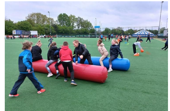
Koningsspelen Sportpark Vrijenbroek

De kleuters sporten in het speellokaal. Ook zij dragen gymschoentjes. Deze blijven op school.