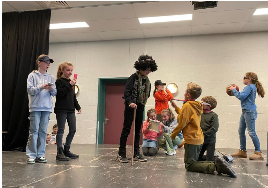
Viering van groep 6 In de Dörpel