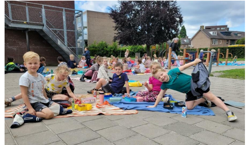
Picknicken op het schoolplein