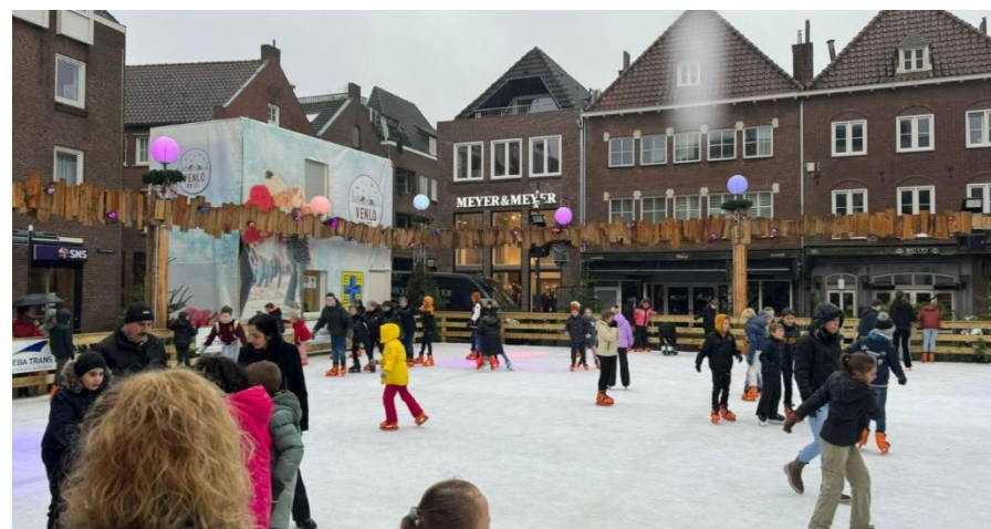
Schaatsen in de stad