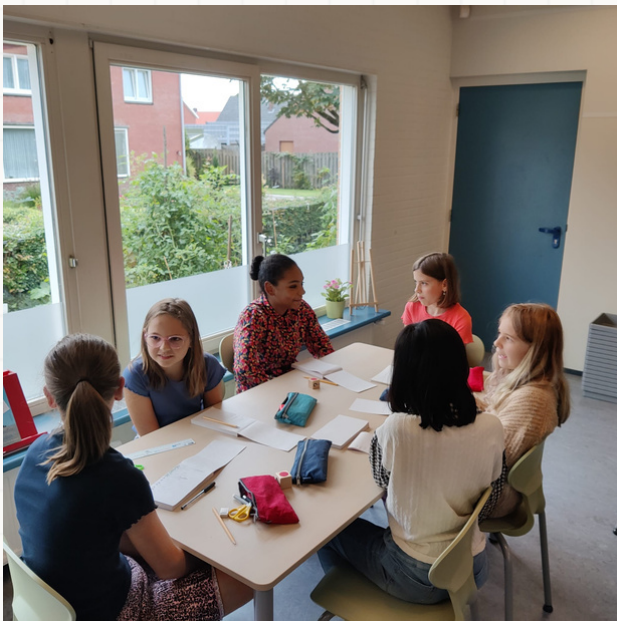
Vertellen over de vakantie

Ook hebben we, aan de hand van werkwoorden die centraal stonden in onze vakanties, vakantie verhalen geschreven. Zo werden er verhalen geschreven over zwemmen , stadten en nog avontuurlijker, over ziplinen en paragliden .