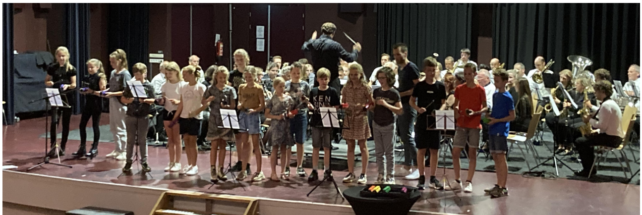
Foto: Optredens leerlingen De Neerakker i.s.m. harmonie l'Union Heythuysen (juni 2022)

De SPOLT-basisscholen onderschrijven het belang van goede brede cultuureducatie en maken structureel en/of projectmatig gebruik van de faciliteiten die geboden worden op dit gebied. Met nationale- (Cultuureducatie met Kwaliteit -kortweg CmK-, Impuls Muziekonderwijs) en regionale subsidieregelingen (DOOR! en SamenDOOR!) werd de laatste jaren kunst- en cultuureducatie binnen het primair onderwijs gestimuleerd, waarbij de focus lag op het stimuleren en verbeteren van muziekonderwijs.