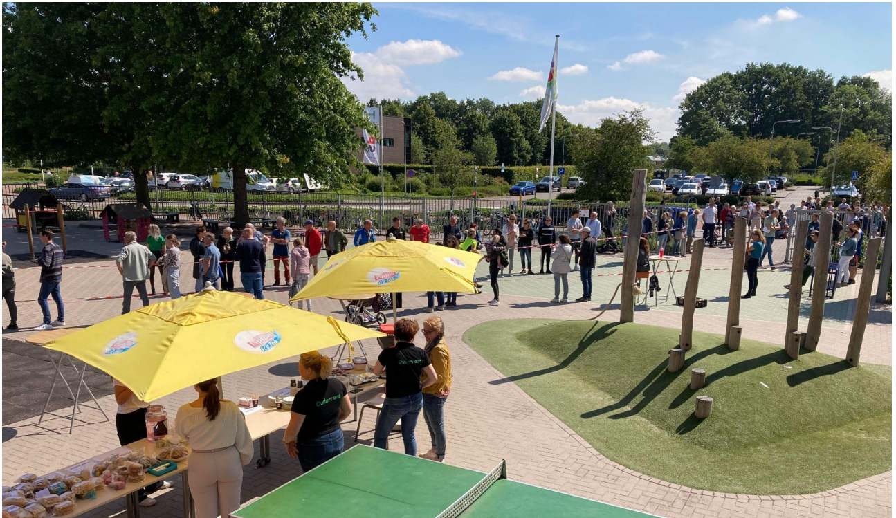
Foto: Impressie sponsorloop 2022 met hulp van de Ouderraad

We begrijpen dat veel verenigingen behoefte hebben om reclame te maken. School verspreidt alleen flyers e.d. indien het kindbelang hiermee gediend is. Denk aan kindervakantiewerk en overige sportieve of culturele activiteiten (in kern Heythuysen en/of in gemeente Leudal).