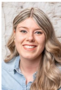
Vaya Hol Groep 4