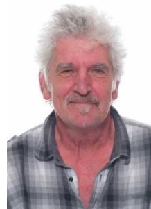
Frans Beusen Groep 6 en 8