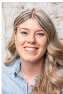
Vaya Hol Groep 4