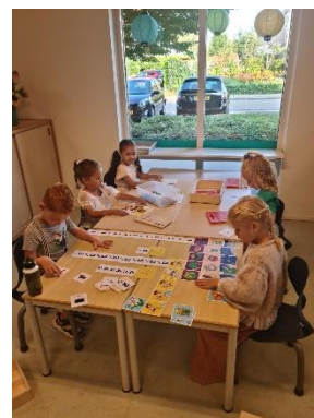
Werken aan de tafel.