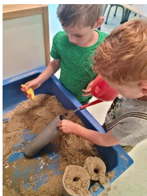
Spelen in de zandtafel