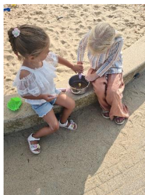
Spelen in de zandbak