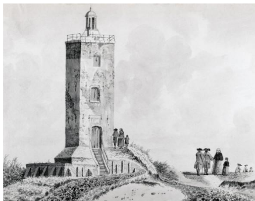
De Vuurbaak op een oude tekening.

De Vuurbaak die er nu staat, is gebouwd in 1605. Dat is meer dan 400 jaar geleden. Er stond al eerder een vuurbaak in Katwijk. Maar de zee kwam te dicht bij. Daarom werd een nieuwe toren iets meer landinwaarts gebouwd.