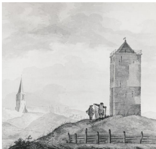
Een oude tekening van de Vuurbaak.