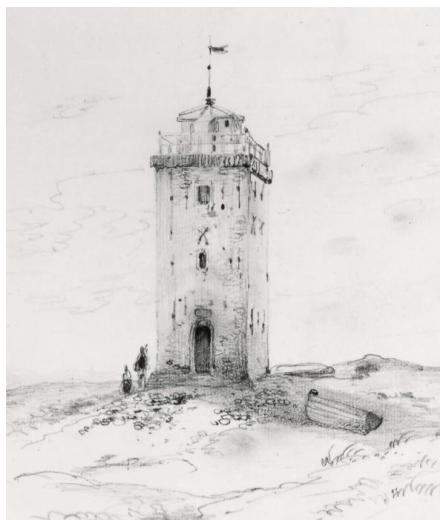
Boven op de toren was vroeger licht.