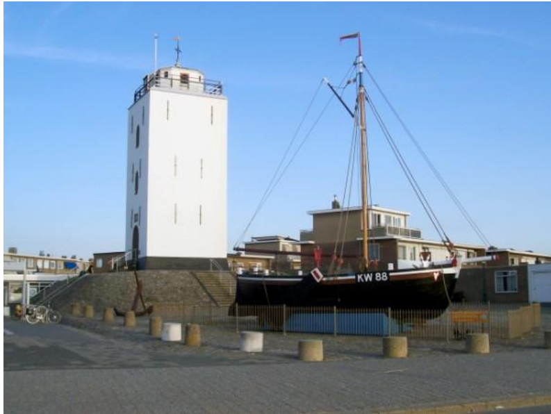
Op het plein staat in de zomer de KW88 'Zorg en Hoop'.