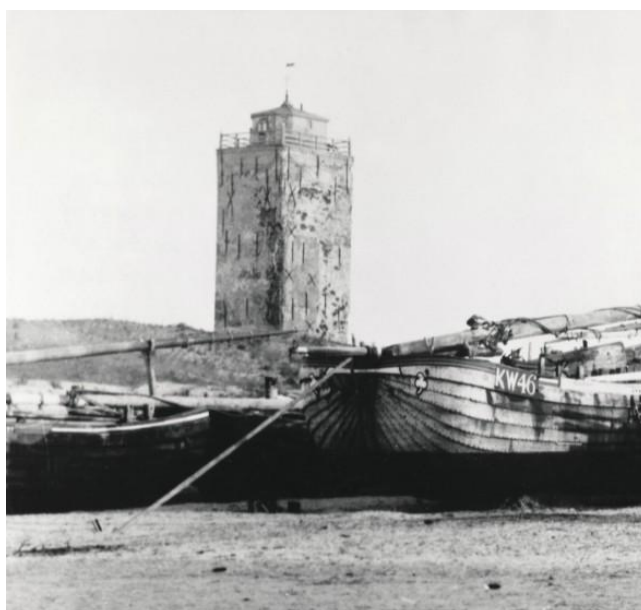
Bomschuiten bij de Vuurbaak.

Na een tijd kwamen er havens in IJmuiden en Scheveningen. Toen gingen vissers andere schepen gebruiken. Rond 1912 kwamen de laatste bomschuiten in Katwijk aan.