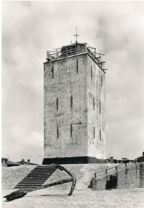
De toren werd vaak opgeknapt, zodat hij bleef staan.