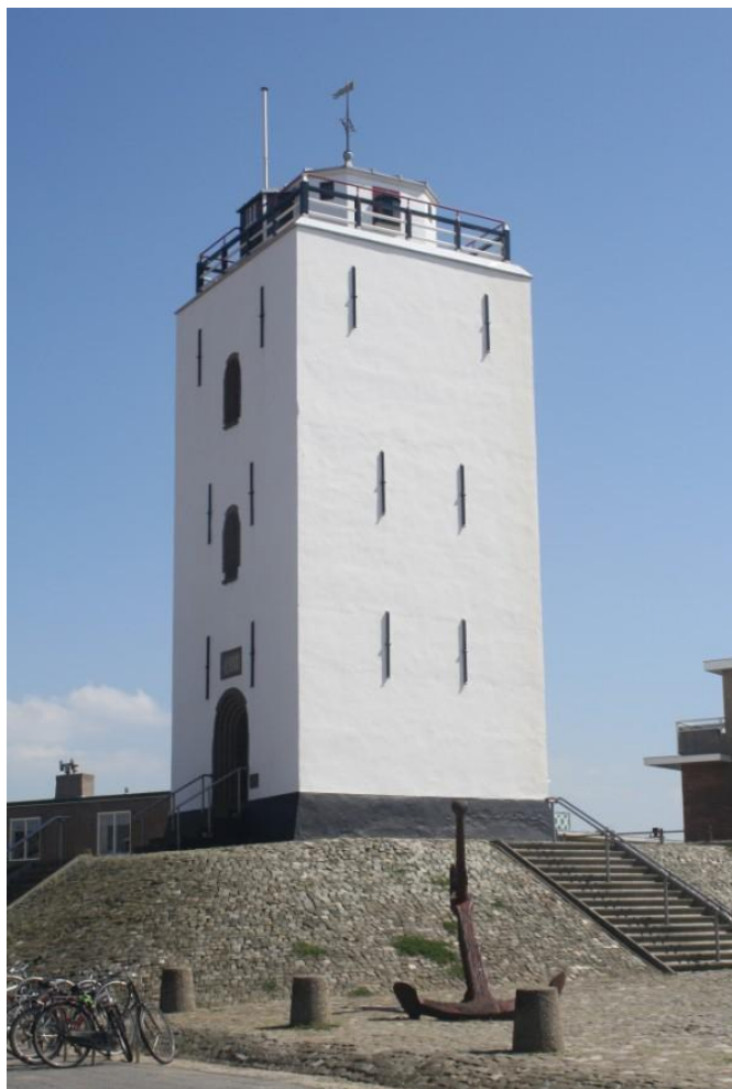
De Vuurbaak is nog steeds een blikvanger.