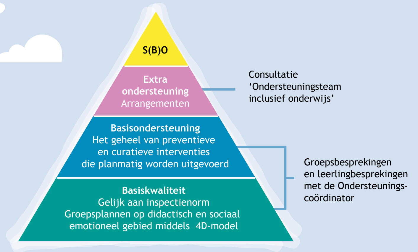
Niveaus van ondersteuning binnen RBOOB

Binnen RBOOB werken we planmatig aan het verbeteren van de onderwijskwaliteit middels het 4D-model.