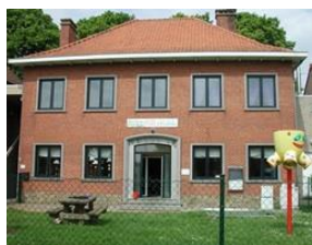
't Kliekske Molenstede Dorpstraat z/n 3294 Molenstede t. 013 32 69 22