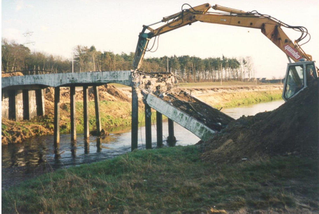
Sloop Aa brug bij de oude St Jozefkapel tbv kanaalomleiding Helmond. anno oktober 1988