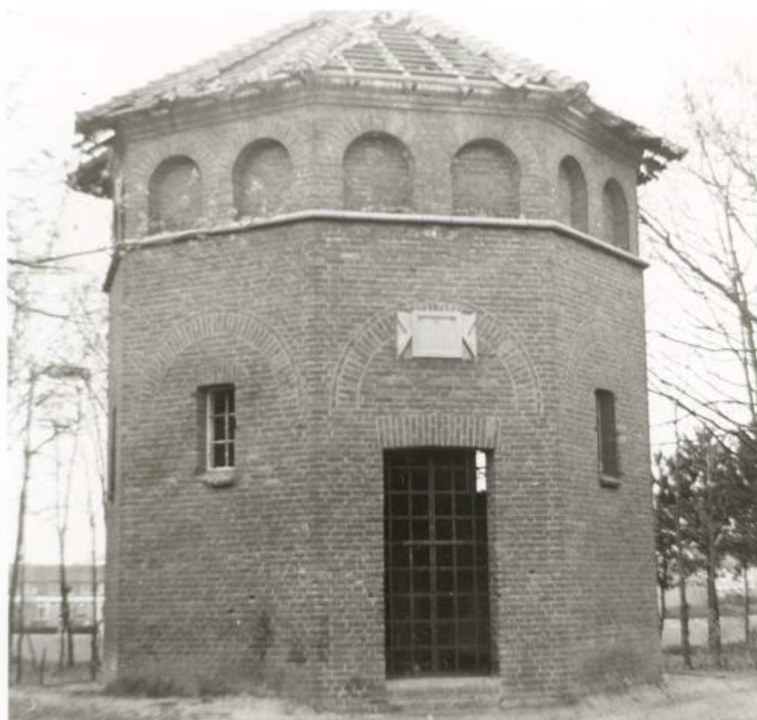
Jozefkappelletje in Bakelse bossen, is later herbouwd in Hortensiapark