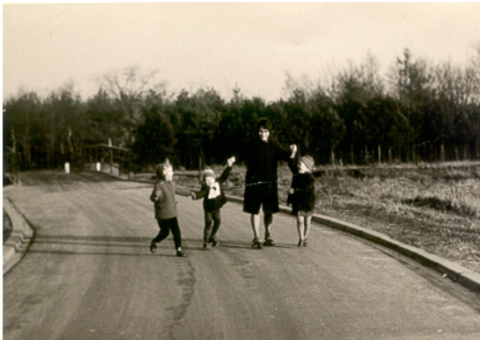
Straakvense Heideweg (verlengde van de Van Meelstraat) met op de achtergrond de oude Aabrug bij het voormalige St Jozefkapelletje en speeltuin