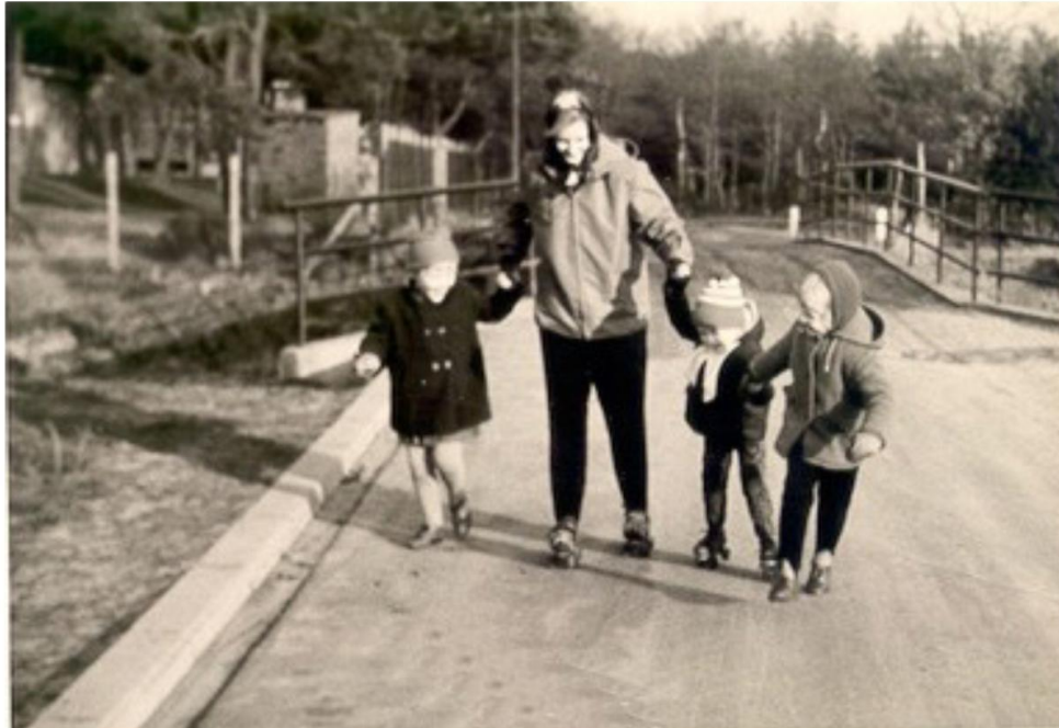
Straakvense Heideweg (verlengde van de Van Meelstraat) met op de achtergrond de oude Aabrug bij het voormalige St Jozefkapelletje en links de speeltuin. Helmond