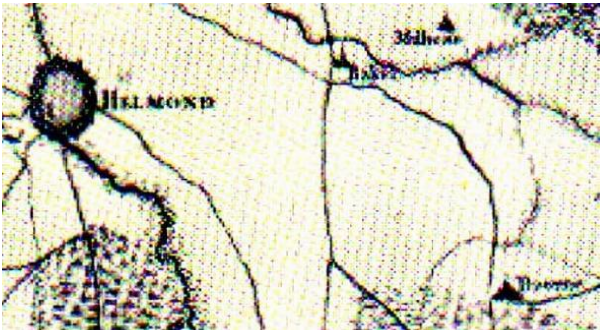
detail van regiokaart, 1790, links Helmond, midden boven Bakel, rechts onder Deurne

Helaas is de Rijpelberg op veel kaarten verdeeld in een noordelijk en een zuidelijk stuk.