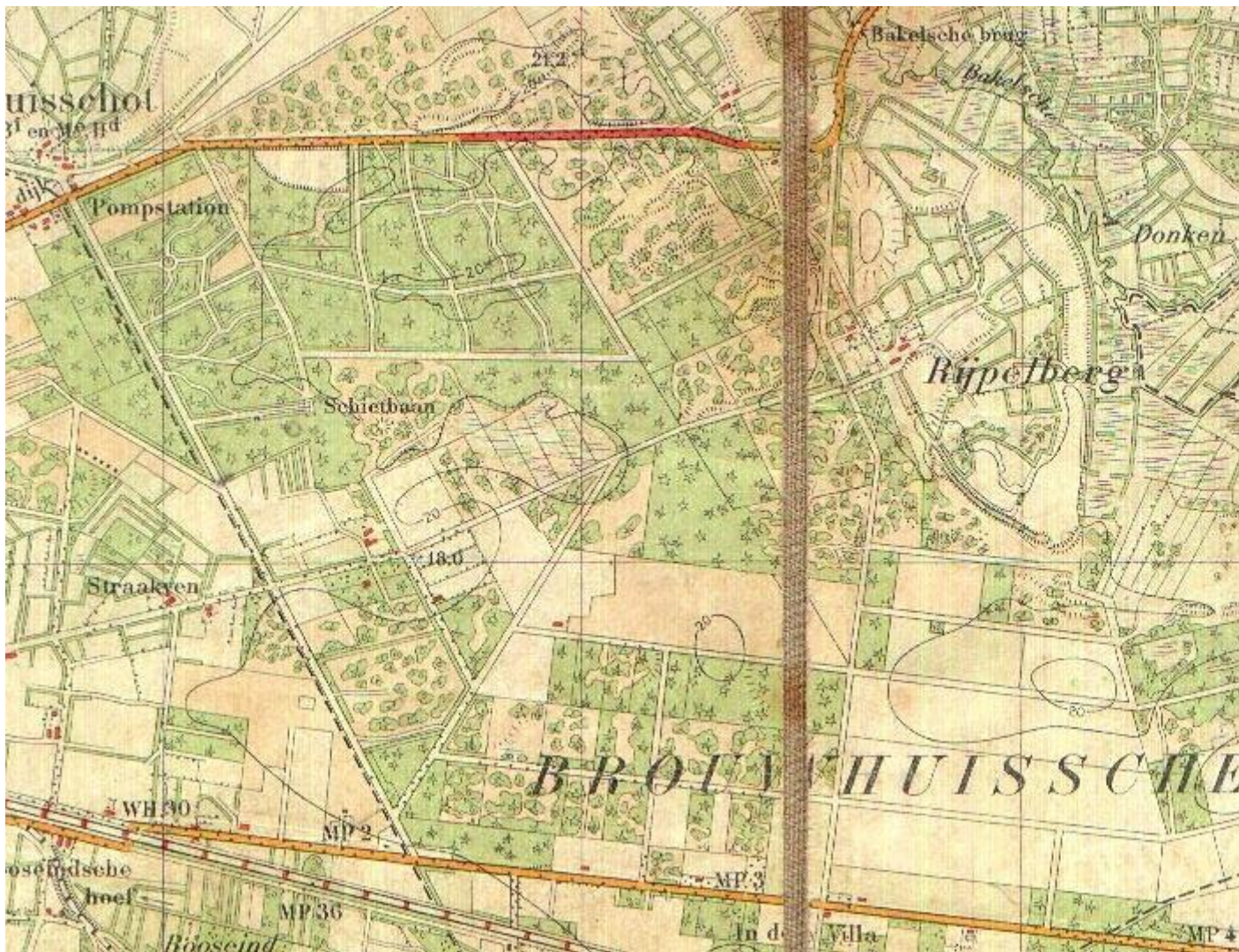
detail van blad 51F, 1:25.000, 1921