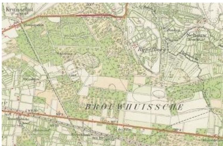
detail van blad 51 Oost, 1:50.000 , ca. 1929