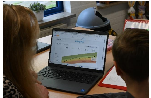
Foto: Leerkracht bespreekt de groeigrafiek

Door middel van kindgesprekken en ons kindportfolio zijn de leerlingen zelf eigenaar van hun eigen leerproces. Binnen de vakken rekenen (groep 5-8), en een groot gedeelte van ons taalonderwijs werken de kinderen met Snappet op een eigen chromebook wat ze van school lenen. Het voordeel van het werken met Snappet is dat de leerkracht realtime de vorderingen van de leerling kan volgen en meteen feedback kan geven. Per leerling wordt naast de basislesstof ook een pakket aan persoonlijke ontwikkeldoelen klaargezet. Begrijpend lezen wordt verder aangeboden via JELO. Hier gebruiken we de JELO-teksten voor. Het aanvankelijk leesproces in groep 3 vindt plaats via de methode Veilig Leren Lezen. Het rekenen in groep 3 en groep 4 bieden