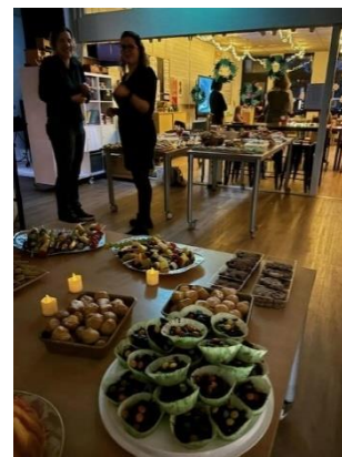
Foto: OV helpt met de Kerstviering

Op veel manieren ondervinden wij steun en hulp van ouders bij het organiseren van activiteiten. Vanuit elke klas zijn er twee ouders vertegenwoordigd in de oudervereniging. In de eerste week van oktober worden weer verkiezingen gehouden voor de klassenouders. Volgens het reglement treedt er per groep één lid af. In principe kan iedere ouder lid worden van de oudervereniging. De oudervereniging vergadert ongeveer zes keer per jaar. Het schoolteam hoopt dat voldoende ouders zich hiervoor opgeven. Immers, alles wat de oudervereniging doet is in het belang van onze kinderen. Wanneer de nieuwe leden bekend zijn, informeren wij u hierover.