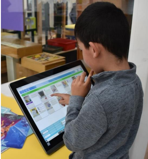
Foto: een kind aan het werk op het digikeuzebord

In een duidelijke structuur wordt onderwijs efficiënt en effectief weggezet in een jaarplanning. Als onderbouw zorgen we dat onderwijs in een doorgaande lijn wordt vormgegeven: van peuterlijn naar kleuterlijn naar afstemming en doorgaande lijn van groep 3.