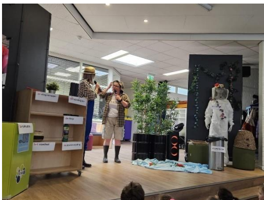
Foto: opening JEELO-thema "omgaan met natuur" door onze leerkrachten

Met "Mijn JEELO" kunnen leerlingen overal en altijd leren. Ze hebben zicht op hun eigen ontwikkeling. In samenspraak met de leerkracht geven ze hun leerroute zelf vorm. IKC de Bongerd heeft de keuze gemaakt om rekenen en spelling nog niet te integreren binnen JEELO. Voor begrijpend lezen is bewust gekozen om dit wel te integreren.