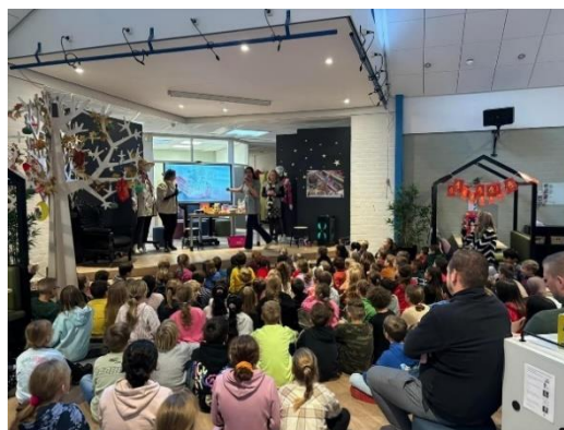
Foto: opening JEELO-thema "omgaan met geld" door onze leerkrachten