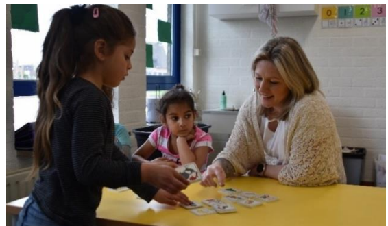
Foto: de kleuterjuf is in de kleine kring aan het werk

We streven naar kwalitatief en interactief onderwijs waarbij ontwikkelingsgericht werken ons kader vormt. Het basisaanbod wordt bepaald door de te behalen kerndoelen als uitgangspunt te nemen. De doelen die aanbod komen per thema worden ook weggezet in de hoeken. We bieden het doel in een kleine kring aan, de kinderen gaan er vervolgens mee aan de slag en de leerkracht speelt met de leerlingen mee in de hoeken om te observeren of ze doelen beheersen of dat er extra instructie nodig is.