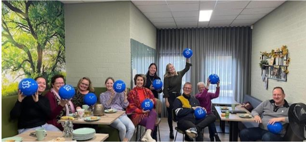
Foto (gedeelte van het team) genomen na de presentatie van het nieuwe logo van Meerderweert

De meerjarenplanning van vier jaar wordt uitgewerkt in ons schoolplan en is een afgeleide van het Koersplan van Meerderweert.