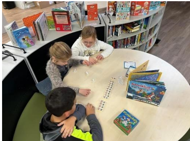
Foto: de leerlingen zijn bezig met het rekencircuit op het leerplein

De leerlingen leren rekenen door het zoeken naar oplossingsmethoden. Naast hoofdrekenen en cijferen, komen inzichtelijk rekenen, breuken en procenten aan bod. De verwerking vindt plaats op Chromebooks en bijhorende werkboeken, de kinderen hebben allemaal een wisbordje en zijn er rekenmachines en vooral ook wis-bordje. Vooral het handelend bezig zijn met verschillende materialen wordt gestimuleerd.