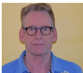
Lammert Groep 5 - 8