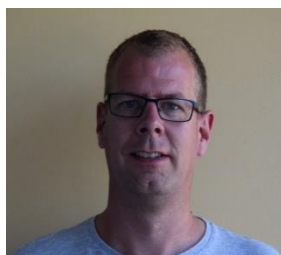
Sjors MT middenbouw