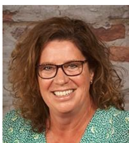
Annelies Groep 1 - 4