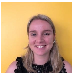
Quinty groep 8a