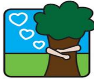
ZORG GOED VOOR JE OMGEVING