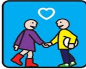
ZORG GOED VOOR DE ANDER