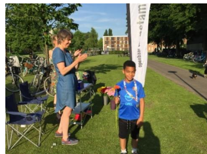
De eerste die zijn medaille voor de 5 kilometer in ontvangst mocht nemen.

We willen alle kinderen die mee hebben gelopen feliciteren en alle ouders bedanken voor de logistiek, want het was een drukke week.