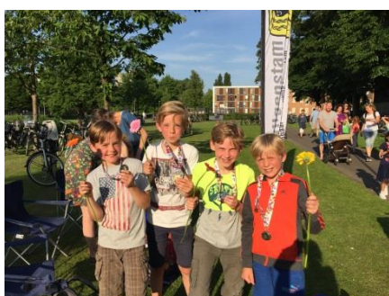
Het eerste groepje van de 10 kilometer was ook al snel binnen.